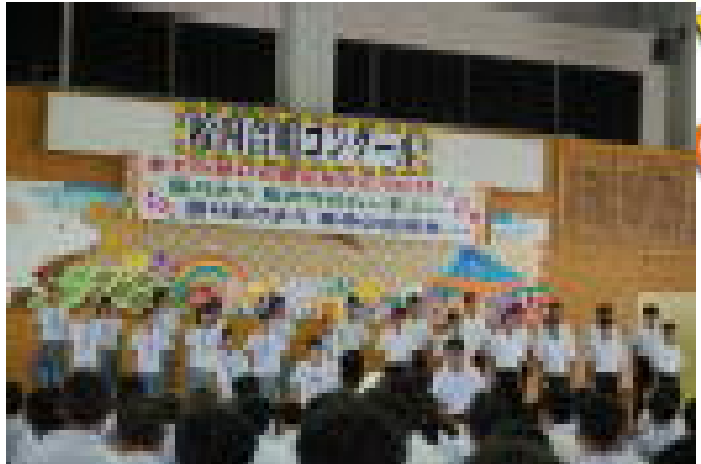
グランプリに輝いた3年2組

10月24日(土)13:00から「全ての想いと響きをひとつに！！届けよう 私たちのハーモニー 創り上げよう 本中の伝統を・・・」の学校テーマのもと、校内合唱コンクール2020が開催されました。コロナ禍の中、歌声は飛沫が飛び交うということで、音楽の授業も工夫しながら実施せざるを得ない状況での開催となりました。生徒の頑張り