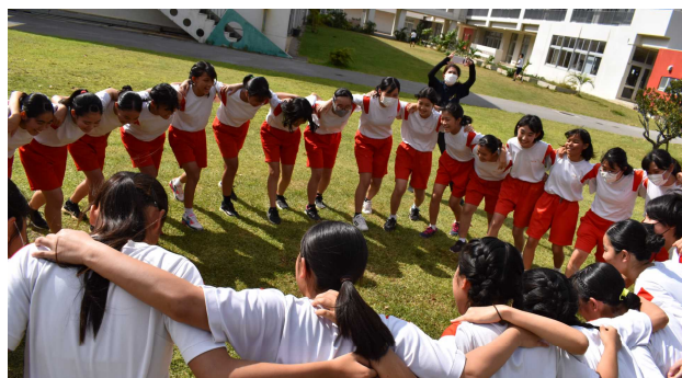
自分たちの運動会を自分たちで成功させようとする気持ちが伝わってきます。