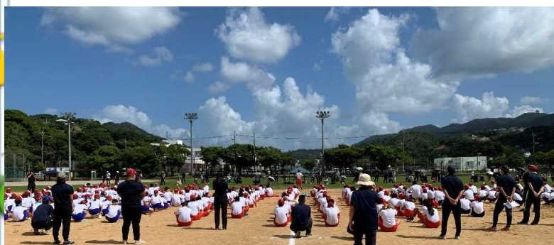
運動会開会式：今年はコロナ対策で多くの保護者に見ていただくため芝生側を向いての演技となりました。

それぞれの行事は生徒が主役です。生徒の皆さん！前面にた立って行事を盛り上げていってください。保護者の皆さんも変わらぬ御支援をお願いします。