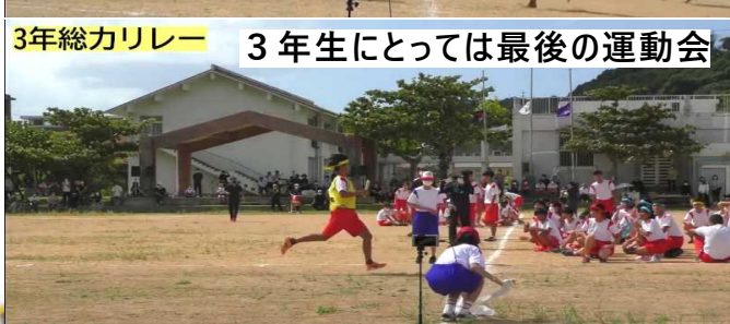
3年総力リレー 3年生にとっては最後の運動会

ほとんどの練習ができない中で、夫やダンス、総力リレーを開催できました。実行部の皆さん、お疲れ様でした。