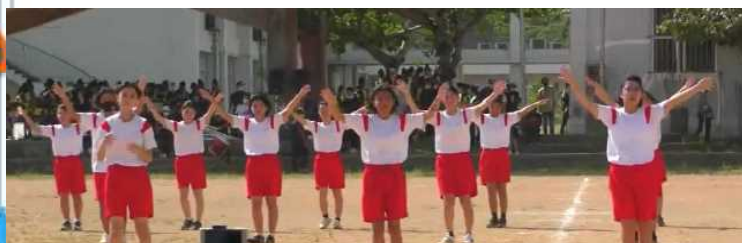
ダンスの演技の様子：映像はYouTubeでも配信されています。